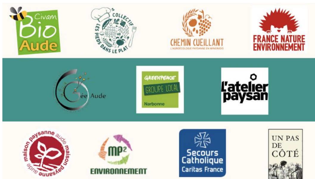
Fig.1. Logo des structures membres du comité de pilotage de la Caisse d'alimentation de Lézignan-Corbières.