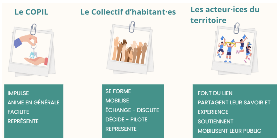
Fig.2. La gouvernance du projet de Caisse d'alimentation de Lézignan-Corbières.

En marge des dynamiques institutionnelles peu réactives, ce projet de Caisse incarne le rôle politique des réseaux alternatifs citoyens dans la réponse concrète aux inégalités alimentaires et dans la proposition de nouveaux modèles démocratiques de production et de consommation. En effet, même si les subventions viennent majoritairement d'un appel à projet national, les collectivités locales n'ont pas ou très peu soutenu le projet pour voir le jour.